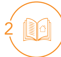
Définition du projet Rendez-vous, visite sur site si besoin