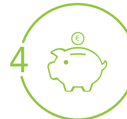
Financement & travaux Aide à la recherche de financements