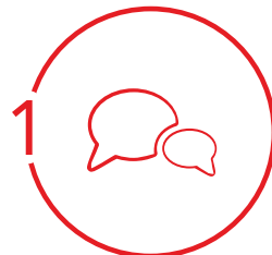
Premier contact Cœur de Savoie ou ASDER