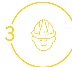
Choix techniques Choix des travaux Sélection des devis