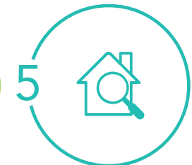
Mesurer les résultats Vérifier les économies d'énergie